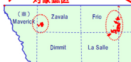
(※)テキサス州 郡の名称