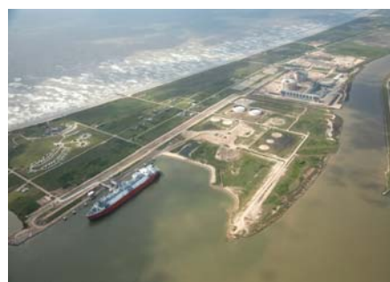
フリーポートLNG基地