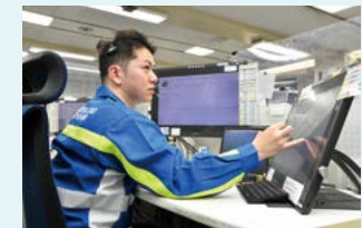
中央指令室(通報の受け付け)

なお、ガスもれ等の通報は、24時間365日、専用電話で受け付けています。通報受け付け後は、警察・消防などの関係機関と緊密に連携しながら、直ちに現場に駆けつけます。