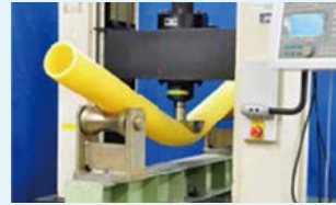
強度に優れたポリエチレン製のガス管

大阪ガスネットワーク(株)は、ガス導管網を通じて都市ガスをお客さまにお届けしています。ガス導管の安全確保と適切な維持管理を最重要課題の一つと考え、古い金属製のガス管については、耐久性と耐震性に優れたポリエチレン(PE)管への入れ替え工事を進めています。