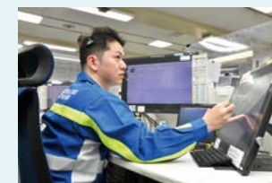
中央指令室(通報の受け付け)

なお、ガスもれ等の通報は、24時間365日、専用電話で受け付けています。通報受け付け後は、警察・消防などの関係機関と緊密に連携しながら、直ちに現場に駆けつけます。