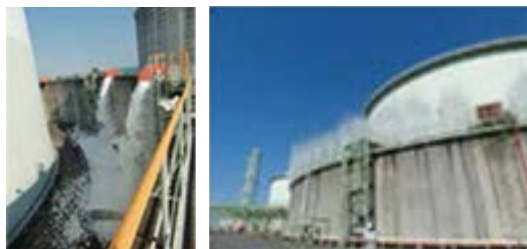
LNGタンクの防液堤に設置している高発泡設備および水幕設備

これらのタンクには、高度な耐震技術を採用しています。また、防液堤を設け、万一LNGがもれ出しても外部に流出しない構造としています。さらに、防液堤内に流れ出た場合にLNGの拡散や火災の影響を防ぐため、大量の泡を放出する高発泡設備と、水幕をスクリーン状に形成する水幕設備を設置しています。