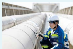
橋梁管の定期点検