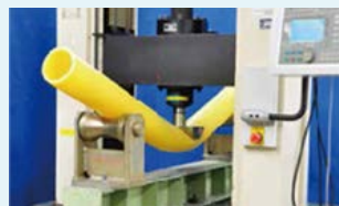
強度に優れたポリエチレン製のガス管

大阪ガスネットワーク(株)は、ガス導管網を通じて都市ガスをお客さまにお届けしています。ガス導管の安全確保と適切な維持管理を最重要課題の一つと考え、古い金属製のガス管については、耐久性と耐震性に優れたポリエチレン(PE)管への入れ替え工事を進めています。