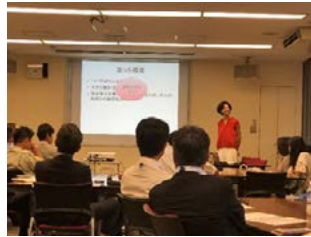
管理監督者向けメンタルヘルス研修