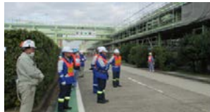
協会社との安全パトロール風景 (2022年度は後期にコロナ対策を講じつつ少人数で実施)

内管工事部門では、高齢作業者の脚立からの転落・転倒災害を防止するため、協会社と一緒に身体能力向上を目的とした体操を実施しています。