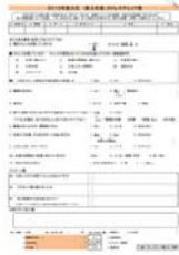
2年目社員を対象に実施しているストレスに関する問診