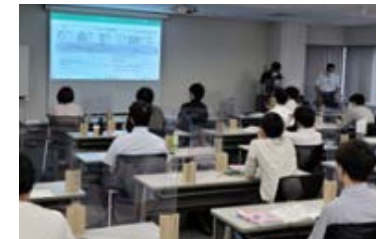
安全衛生教育の様子

労働安全衛生法第60条に基づき、新たに職務につくことになった職長(第一線現場監督者)または労働者を直接指導や監督することになった方に対する安全衛生教育を、中央労働災害防止協会の講師をお招きして開催しています。Daigasグループでは職長等教育が必要な新任管理者を対象に年5回開催し、約160人が受講しています。