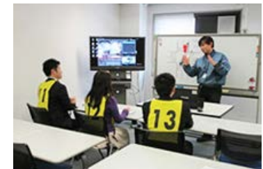
「安心運転訓練センター」講習風景

また、社内イントラネットおよびメール等により、グループ全体の災害を削減するための情報共有・情報発信を行っています。