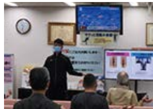
サクッと運動&体操