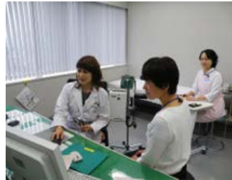
Daigasグループ健康開発センターでの健康診断

当センターは関係会社も利用することができ、2022年度は34社13,715人(大阪ガス・関係会社合計)が定期健康診断を受診しました。