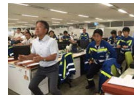
始業前の健康体操実施風景・スクワット

併せて「移動時には両手をあけて転倒防止！」を啓発するポスター」を制作し、全組織に発送しました。