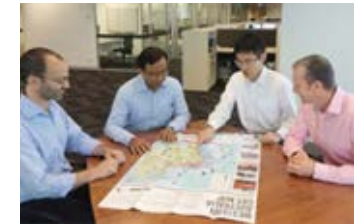
「トレーニー制度」で海外勤務を経験する大阪ガス従業員（右から二人目）