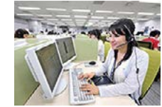
お客さまセンター