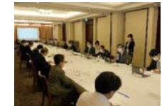
関西消費者団体連絡 懇談会の様子