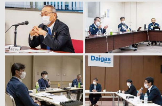
社長の職場訪問の様子