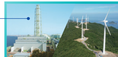
発電 再生可能エネルギー

泉北天然ガス発電所をはじめとした天然ガス火力発電を中心に、コージェネレーション、再生可能エネルギー電源など多様な電源で発電しています。