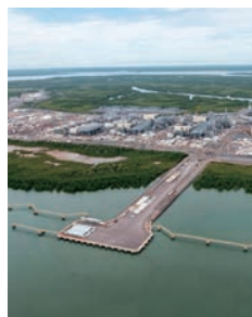
イクシスLNGプロジェクト

上流事業、液化事業に参画し、事業領域を拡大することで、より低廉かつ安定的なLNG調達を実現していきます。