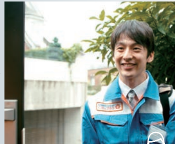
保安販売・サービス