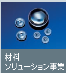
材料ソリューション事業