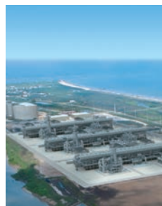
フリーポートLNG基地完成予想図