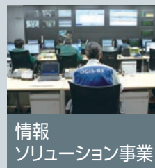
情報ソリューション事業