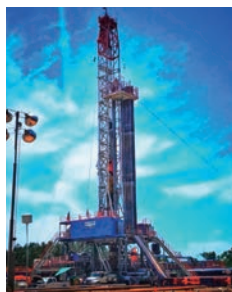
東テキサスシェールガスプロジェクト