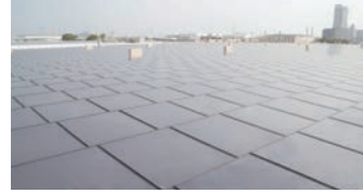
西島太陽光発電所

再生可能エネルギー電源の開発にも積極的に取組むことで、競争力があり、環境に優しい電源ポートフォリオの構築を目指します。